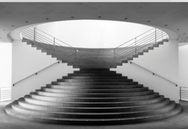
Kunstmuseum di Bonn, scalone interno

L'Istituto Storico della Resistenza e dell'Età Contemporanea della provincia di Savona (ISREC) è parte della Rete degli istituti associati all'Istituto Nazionale Ferruccio Parri (ex Insmli) riconosciuto agenzia di formazione accreditata presso il Miur (L'Istituto Nazionale Ferruccio Parri con la rete degli Istituti associati ha ottenuto il riconoscimento di agenzia formativa, con DM 25.05.2001, prot. n. 802 del 19.06.2001, rinnovato con decreto prot. 10962 del 08.06.2005, accreditamento portato a conformità della Direttiva 170/2016 con approvazione del 01.12.2016 della richiesta n. 872 ed è incluso nell'elenco degli Enti accreditati).